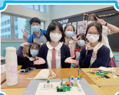
堅毅-朋輩輔導員訓練

本組亦邀請教育心理學家於10月至12月的班主任節為中三級舉辦高中學習技巧講座、中五級及中六級學生管理壓力技巧，讓同學能自我檢視身心狀態，從想法入手，以認知行為舒緩學習壓力，調整心態，堅毅前行。