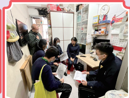
與劊房住戶傾談了解居住情況