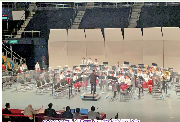
2022香港青年音樂匯演

本校管樂團在疫情下用心練習演奏，積極備戰，迎接四年以來第一次校外比賽：音樂事務處主辦《2022香港青年音樂匯演》。管樂團新成員大多是首次參加大型校外比賽，經驗尚淺，他們自暑假開始一直苦練中學中級組管樂合奏曲目，最終獲得評審讚賞表現優異，實在可喜可賀。