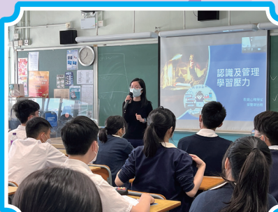
堅毅-管理壓力講座